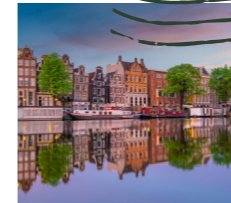
Dagje Amsterdam www.tours-tickets.com