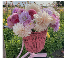
Bloemenvelden aan de kust